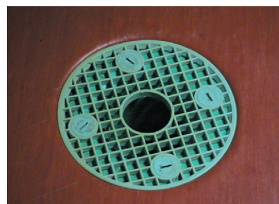
Tarkett® golvbrunn med originalsilar